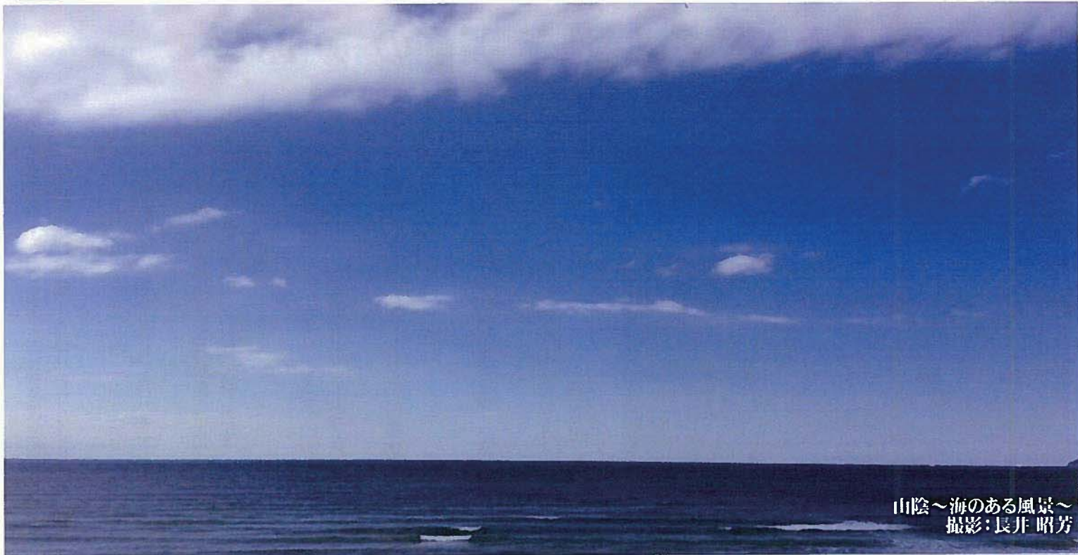
山陰～海のある風景～