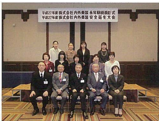
平成27年度株式会社内外美装 永年勤続表彰式 平成27年度株式会社内外美装 安全衛生大会