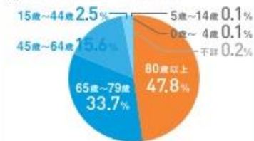
■年齢別／熱中症死亡者の割合